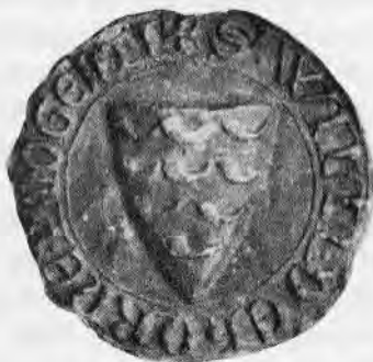
Afb. 6. Zegel van Willem, oudste zoon van Willem II, heer van Horne en Altena.

Oorkonde van 4 nov. 1272. Duitse Orde. Arch. Utrecht. (Corpus Sigill. Neerl. nr. 950).