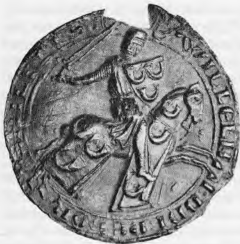
Afb. 5. Zegel van Willem II, heer van Horne en Altena.

Afbeelding: De ridder in volle wapenrusting met 3 hoorns op het schild.