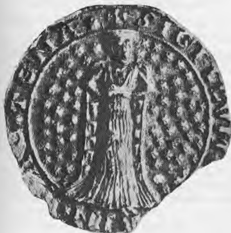
Afb. 3. Zegel van Imaina, vrouwe van Altena.

Afbeelding: De vrouwe in een veld met zespuntige sterren.