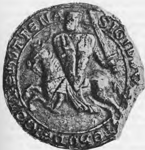
Afb. 1. Zegel van Dirk, heer van Altena. Afbeelding op het schild: twee afgewende zalmen.

Omschrift: SIGILLU - - TEHODERICI DE HOTTENA . .