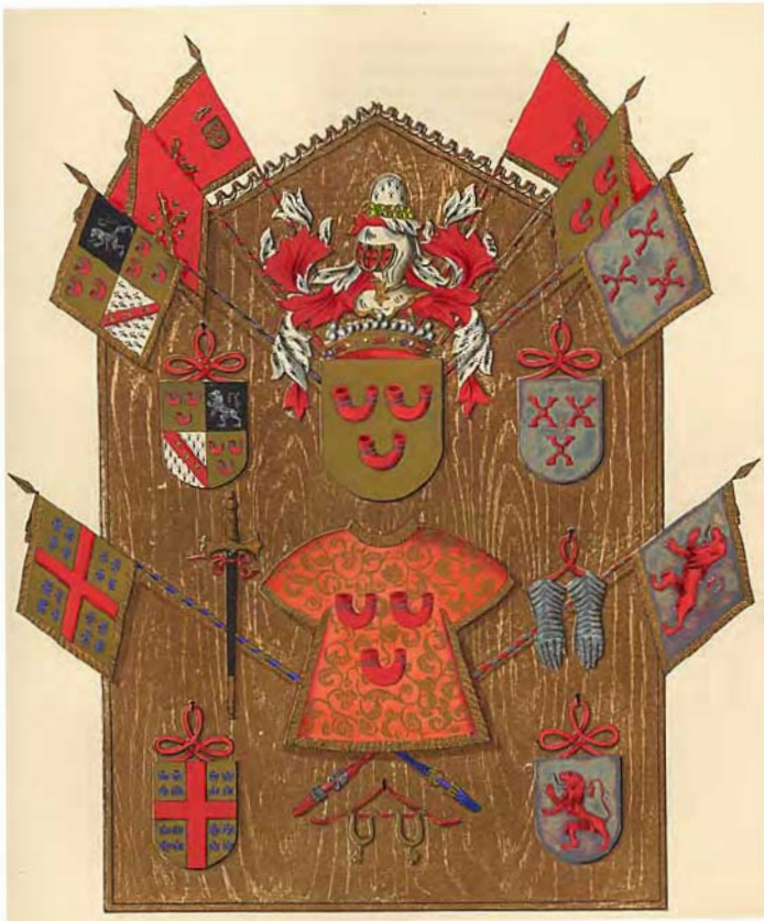
Wapenkabinet van Maarten van Horne . V. GOETHALS , Histoire généalogique de la Maison de Hornes .