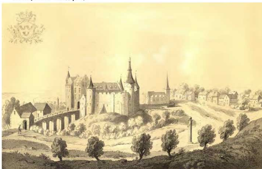
Kasteel en dorp Horn , getrokken uit «Les délices du Pays de Liège». In V. GOETHALS, Histoire généalogique de la Maison de Homes .