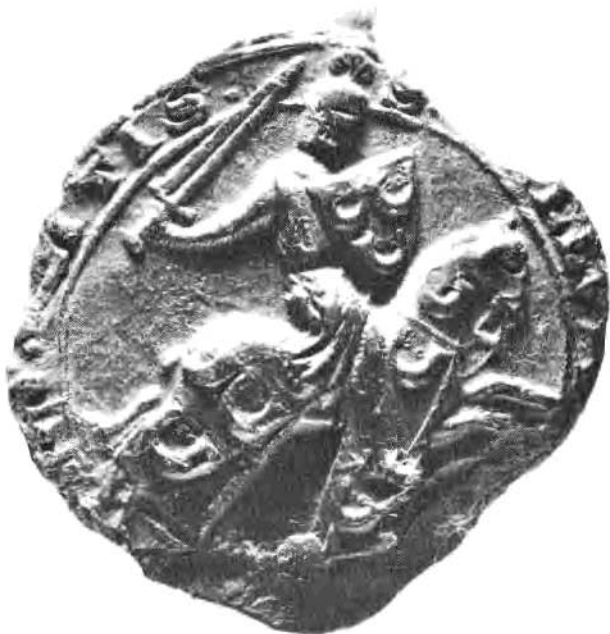
Afb. I. Ruiterszegel van de heer van Horn, hangend aan een charter d.d. 6 januari 1282, berustend in Rijksarchief in Limburg te Maastricht. Archief Abdij Thorn.