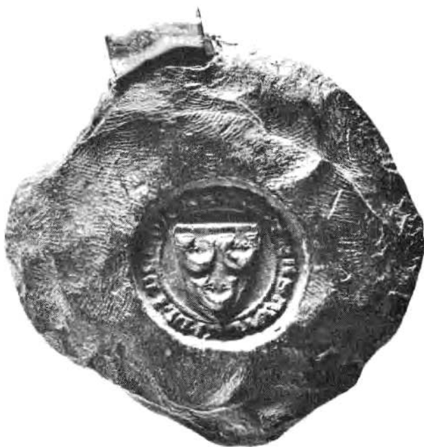
Afb. II. Contrazegel van het hierboven afgebeelde ruiterszegel.