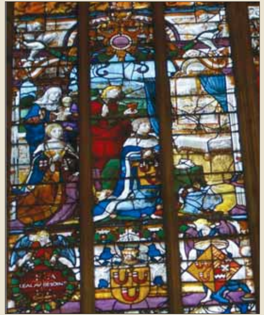
Afbeelding 5, detail raam Lichfield Graaf Jan en Anna van Egmont.

Op de centrale panelen knielt Jan voor een altaar, waarop de lijdende Christus, de Ecce Homo, binnen een lijst is afgebeeld. Op de bidstoel ligt een boek en op de grond ligt een helm. Graaf Jan wordt gepresenteerd door Sint-Jan de Evangelist met als attribuut de kelk. Aan zijn voeten is nog net een duif te ontwaren. De gekroonde graaf gaat gekleed in een blauwe kapmantel, afgeboord met hermelijn. Links van hem knielt zijn vrouw Anna, gepatroneerd door de H. Anna te Drieën. Zij draagt een hermelijnen pelerine en een japon met ingesneden mouwen.