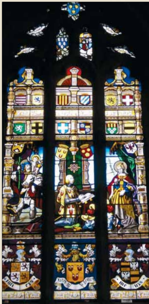
Afbeelding 7, raam 4 Shrewsbury Margaretha