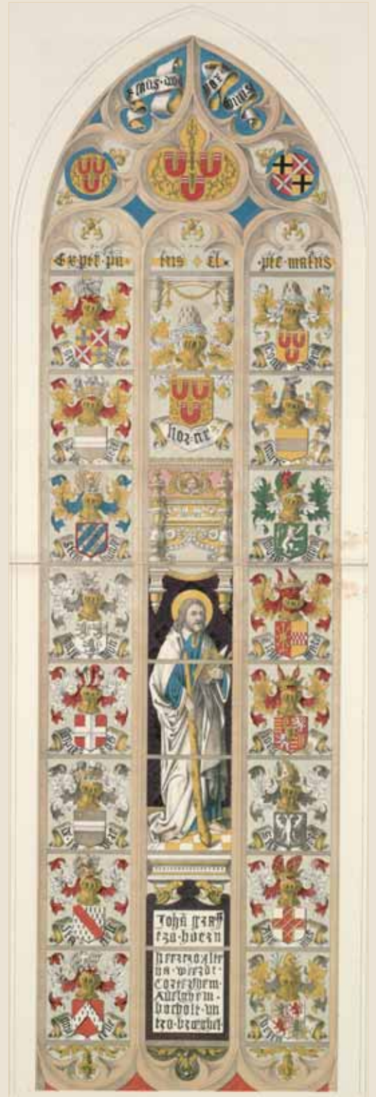
Afbeelding 3, bovenraam Luik Graaf Jan, tekening John Weale.