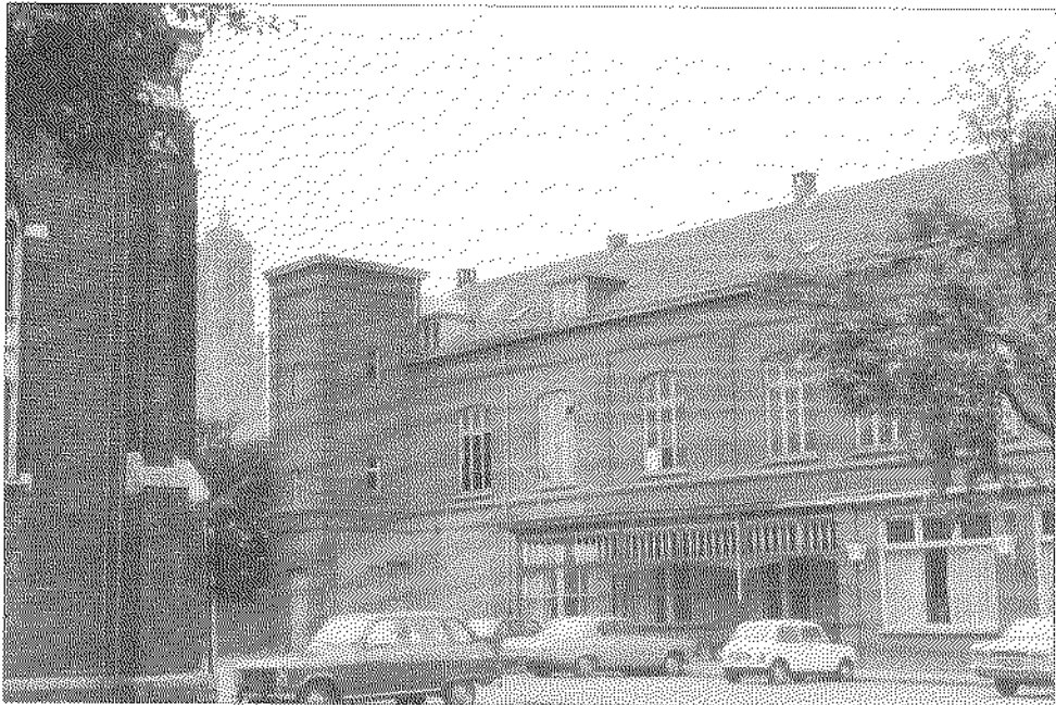
Het Sint Josephsgebouw aan de Wilhelminasingel.

Over de kwaliteit van de drank, met name het bier, kwamen eveneens klachten binnen in 1876. Strijbosch werd hierop aangesproken en werd dringend verzocht voor goede drank te zorgen.