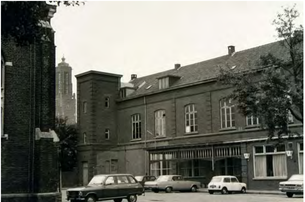
Het Sint Josephsgebouw aan de Wilhelminasingel.