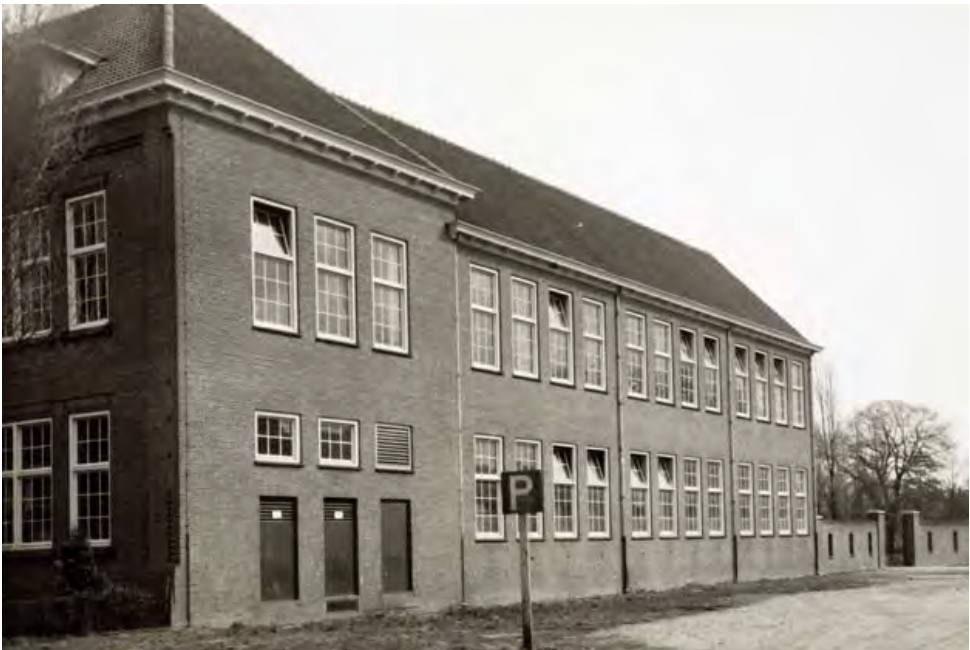
Het schoolgebouw met de nieuwe zijgevel aan de Kasteelswal.

Na al deze bouwerij en plannenmakerij wordt het tijd even stil te staan bij datgene wat in die gebouwen plaatsvond. Zoals reeds gezegd steeg het aantal leerlingen na de oorlog fors. Er waren in die tijd grote gezinnen, waarbij men moet denken aan gezinnen