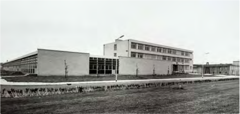
De nieuwe school in het Groenewoud 1970.