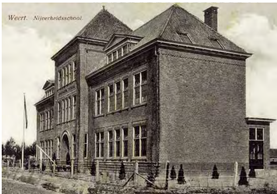
Het schoolgebouw in 1921.