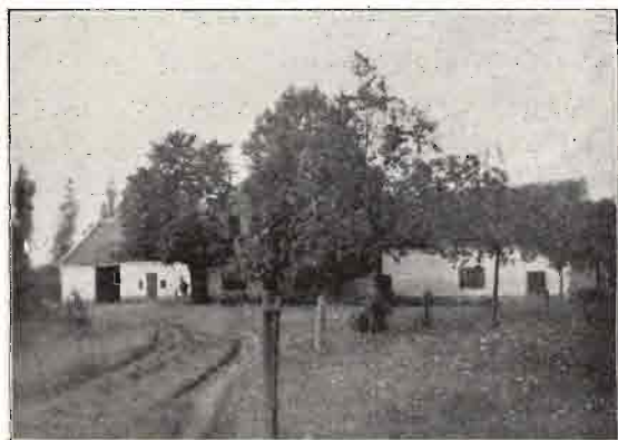
LINDENHOF TE ALT-WEERT.

historie, maar van zoo'n vertelsel kan iets waar zijn. Heel krap heeft er de kapel wel nooit bijgezeten. De H. Antonius, Abt. evenals zijn Naamgenoot van Padua, is nu beslist „ein gooi kroekèr”, een goede Voorspreker, zegt het geloovige volk.