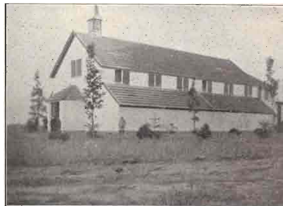
HULPKERK TE ALT-WEERT.

zielen. Het inwontertal slonk in het laatst der 18de eeuw tot 4370. Een „kapelmeester”, wonend bij de kapel, in het huis waarin op 28 Juli 1793 de handboogschutterij „Confrèrie” werd opgericht, zei me, dat een overlevring vertelt dat de St. Teuniskapel,