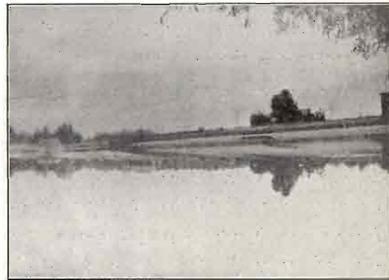
DE IJZEREN MAN MET HET CAFÉ-RESTAURANT.

Aldus „Zjef”. Altweert tusschen de kapel en de Zuid-Willemsvaart is rond 1912 veel veranderd. Daar heeft erica en de gouden brem aanzienlijk terrein verloren. De „ijzeren man” schepte onvermoeid zand dat bij honderd-duizenden M 3 door het viaduct verslonden werd voor de lijn Eindhoven-Weert. De eigenlijke „ijzeren man” kreeg gedaan en vertrok, maar de IJzeren Man, een waterplas van 9 H.A. bleef en werd zelfs met het idyllische: „Iustoord” gedoopt. De IJzeren Man, met zijn