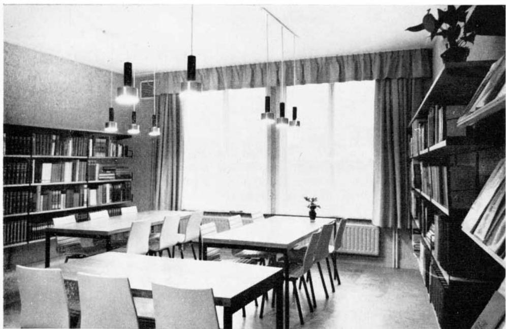
I.eeszaal, gemeubileerd met de zeer geslaagde witte stoelen