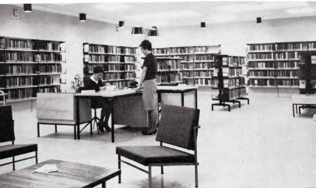
Open uitlening met uitleencentrum