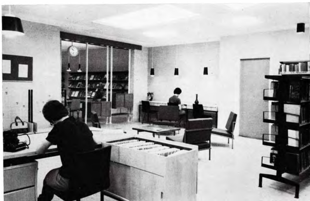
Gezicht op catalogusboek en leeszaal vanaf het uitleencentrum

groen/bruin, het behang is licht groen gehouden, het boardplafond gebroken wit, de deur rood. De Ploeg-gordijnen zijn overwegend rood geblokt.