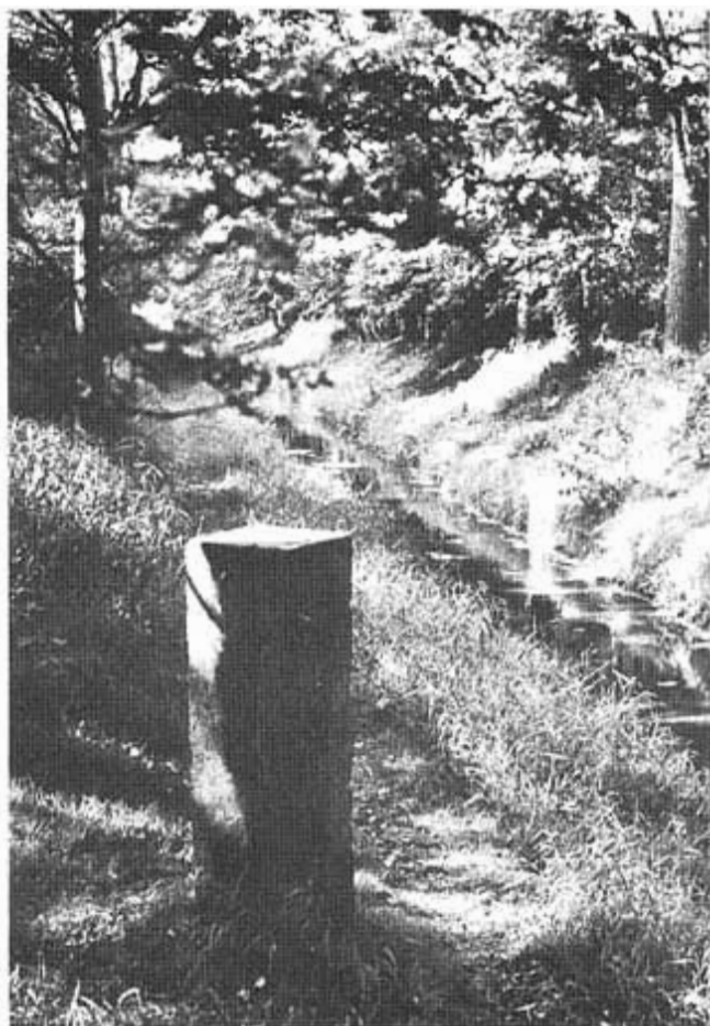
2. Foto van de paal op het punt, waar de Noordbrabantse gemeente Maarheeze en Someren en de Limburgse Weert en Nederweert bij elkaar komen. Van beneden rechts stroomt de Oude Graaf uit het Weerter Bos hier de provinciale grens over in het Sterkselse Kanaal.