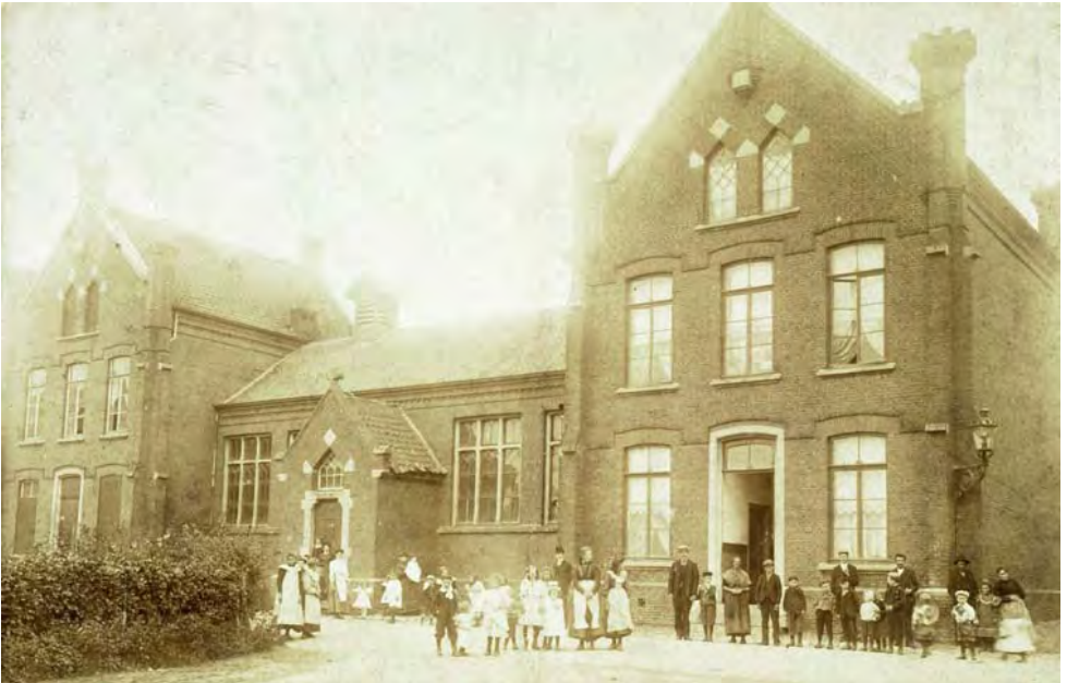
Het schoolgebouw aan de Langpoort.