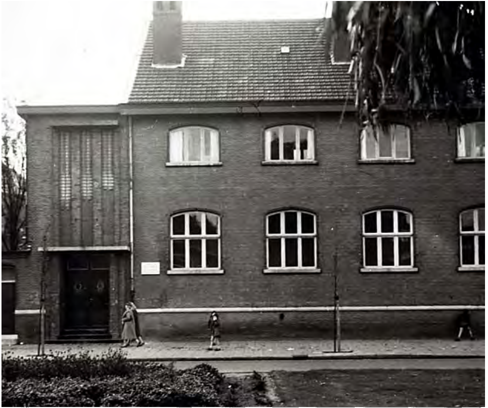
De oude Mulo aan de Emmasingel.

voorgenomen die onraadzaam waren met het oog op de stevigheid of bepaald niet nodig waren voor de woning. Daarbij vond hij het schoolgebouw nodeloos kostbaar. Op 19 november verklaarde de voorzitter in de raadsvergadering dat er een onderzoek was ingesteld door een rijksbouwkundige en dat de voorgestelde wijzigingen direct waren doorgegeven aan de architect.