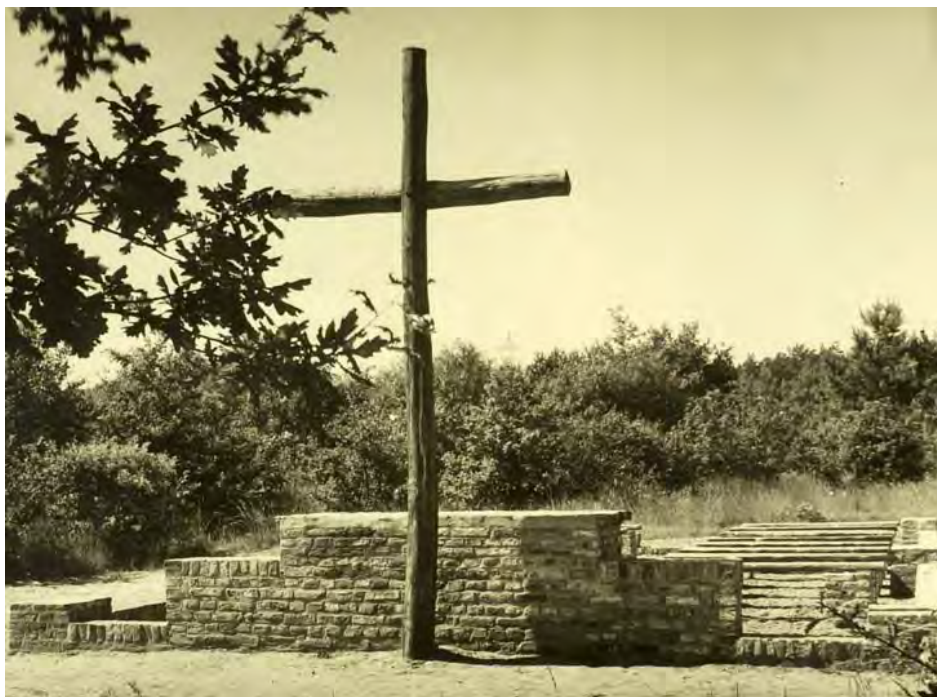
Gedeeltelijke reconstructie Grenskerk in het Weerter Bos van de Katholieken van de Meierij 1648-1672, toen deze na de Vrede van Munster hun godsdienst in hun eigen gebied niet meer mochten uitoefenen.

Rond 1850, toen de ontginningen grootscheeps werden en reeds waren aangepakt, bedroeg de oppervlakte woeste grond in de zuidelijke peel 44% en het bosterrein 7,7%. „Brede heidevlakten strekten zich uit van de Kesselse bergen beneden Baarlo, doorlopend bezuiden Helden en voorbij Meijel tot de Gorte Peel en de Heide benoorden Nederweert. Ten westen van Weert lag