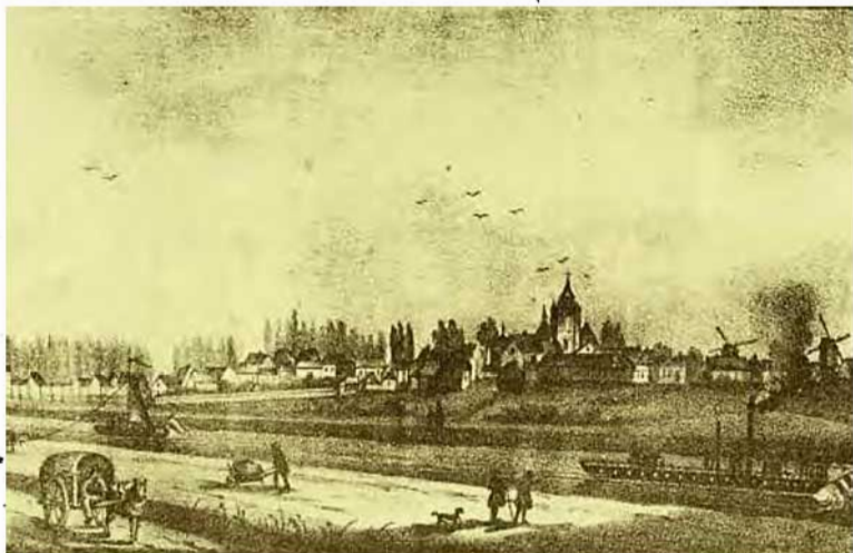
Gezicht op Weert in 1850.