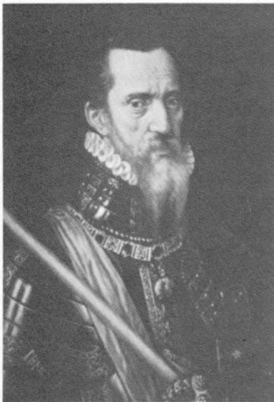
Ferdinand Alvarez de Toledo, hertog van Alva. Portret, geschilderd door Willem Key, in 1568, toen de hertog net in de Nederlanden was gearriveerd.