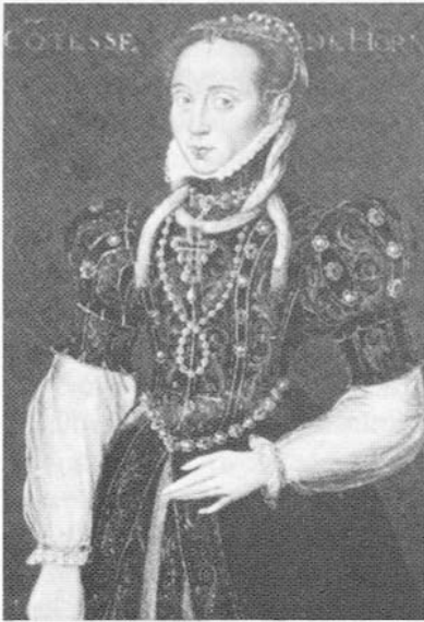
Portret van Walburgis van Nieuenaar, echtgenote van Filips van Montmorency. Nationale Bibliotheek, Wenen.