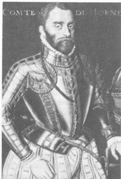
Portret van Filips van Montmorency. Een kopie naar Antonio Moro van Dashorst. Rijksmuseum, Amsterdam.