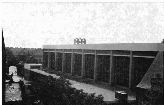
Exterieur gezien vanuit het oude klooster.

een kenmerkende karakterbepaling werd voor het geheel: zoals daar die klokken hangen, zal zowel de verbinding met het historische Weert als ook de associatie aan het moderne industriële Weert zeer discreet tot stand gekomen zijn, want deze klokkentoren doet zowel denken aan een moderne kerk als aan de bekroning van een fabriekscomplex, zonder overigens te nadrukkelijk te werken als storend element voor het oude historische gebouw.