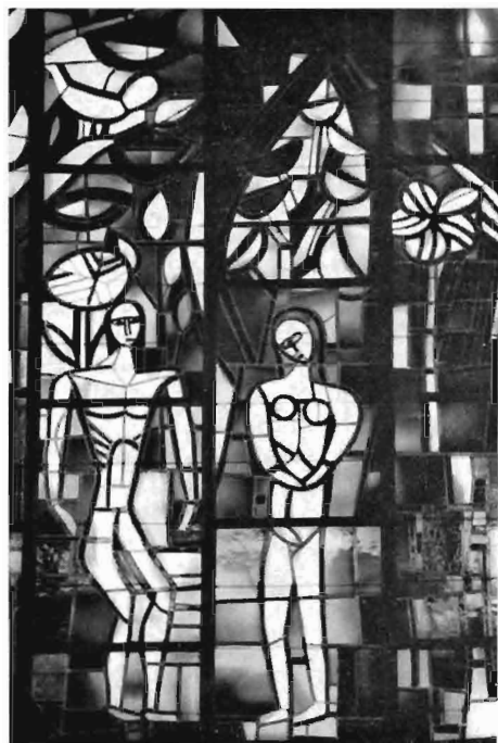
Adam en Eva onder de levensboom. (Detail glaswand van Daan Wildschut.)

Gezien het monumentale karakter van deze opgave, dat de architectuur van deze nuchtere zaalkerk zijn proporties moest geven, beschilderde hij het glas niet, doch werkte de tableaux uit in gebrand antiek-glas, waarin het herkenbare gegeven uitsluitend wordt bepaald door de loodstrips. Vanaf het priesterkoor ziet men achtereenvolgens de verheerlijkte Christus, omgeven door engelen, daarna een verbeelding van de schepping, de triomfale zon, de maan, het sterrenfirmament, dan de levensboom en Adam en Eva, strak maar in vormgeving gespannen in blank glas verbeeld, een grootse ornamentale verbeelding van de dieren, zoogdieren, vogels en vissen en tenslotte de stigmatisatie van St. Frans in een naar kleur brandend tafereel weergegeven naast het oksaal. Het eerste dat opvalt is het