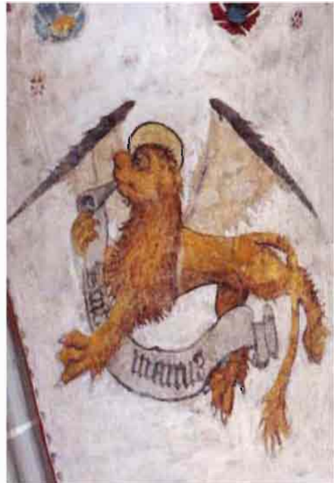
Afb. 2: De evangelist Marcus, gesymboliseerd door de Leeuw.