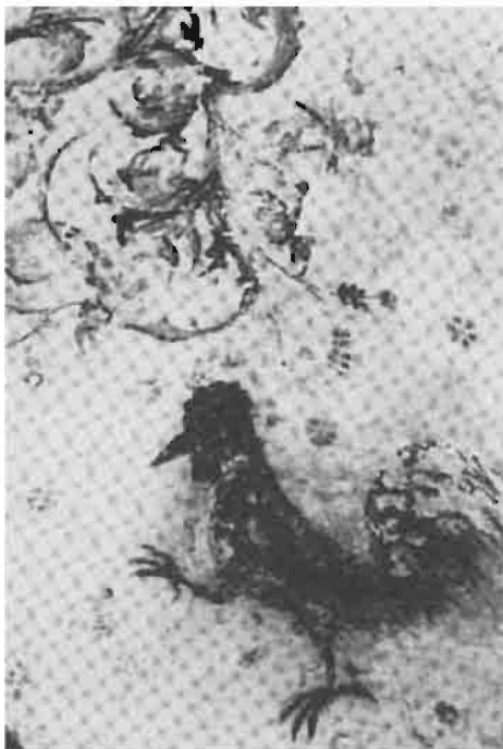
Afb. 11: De haan, zinnebeeld van de priester of van Christus.

In gewelf 6 treffen we de vier evangelistensymbolen aan. Deze zijn geenszins willekeurig over de travee verdeeld; er is ook hier een overwogen planning. De evangelisten Mattheüs en Marcus, uitgebeeld door de mens en de leeuw, bevinden zich in aangrenzende noordelijke schelpen; tegenover hen in de zuidelijke schelpen, als het ware spiegelbeeldig geordend, zijn het rund, symbool van Lucas, en de adelaar, symbool van Johannes, aangebracht. Zo bewonen de vier evangelisten, keurig gerangschikt rond de kern van de 6e travee, vier vlakken van het stergewelf. Twee vogels vormen de overgang naar gewelf 5. Aan de noordkant (alweer) een loopvogel, gekleurd in grijze en grijswitte tinten. Lange gerekte nek, op de kop en rond de hals enkele opstaande veren (afb. 13). De linkerpoot opvallend hoog opgericht als in een stabbeweging. Men heeft in de vogel wel een ibis of een kraanvogel willen herkennen. Vermoedelijk hebben we echter met een reiger te maken. Het is een positief symbool in de christelijke tekentaal. De reiger heeft maar één nest en is zeer honkvast. Hij eet nooit dode dieren. Zo werd hij het symbool van de christen die slechts op God vertrouwt en slechts de levende hemelspijzen eet. Van de dode leer der ketteren wil hij niets weten. De rusteloosheid van de godslasteraars, die