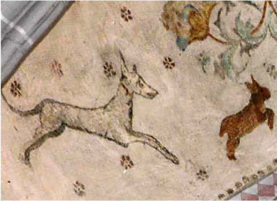
Afb. 4: Hond achtervolgt een haas die bergopwaarts vlucht.

Opvallend is de opwaartse beweging waarmee de haas van de hond wegspringt. De haas heeft in de middeleeuwse dierboeken een positieve betekenis. Hij symboliseert de mens die niet aan de duivel ten prooi wenst te vallen, maar er vandoor gaat. De haas zoekt intuïtief het hoger gelegen gebied op. Op schuin aflopend terrein kan hij met zijn korte voorpoten niet goed rennen, maar bij een vlucht tegen een steilte komt deze eigenschap juist van pas. De betekenis is duidelijk. Loopt de haas bergafwaarts dan is hij een gemakkelijke prooi voor de hond. Zoekt hij echter de berg op dan vindt hij een veilig heenkomen. De haas is de in verzoeking gebrachte christen, de rots is Jezus Christus die hem, ondanks zijn tekortkomingen (vgl. zijn korte voorpootjes) zal redden. Een alerte houding kan de haas, die in wezen steeds bedreigd wordt, redden. Waakzaamheid is voor een christen een eerste deugd, zoals het haasje met de gespiste oortjes in hetzelfde gewelf ons laat zien (afb. 5). In een andere schelp van gewelf 3 slaat een dier met grote sprongen op de vlucht (afb. 6). Angstig draait het zijn kop om. Is het een steenbok die ook op de 'veilige rots' (Christus!) een goed heenkomen zoekt?