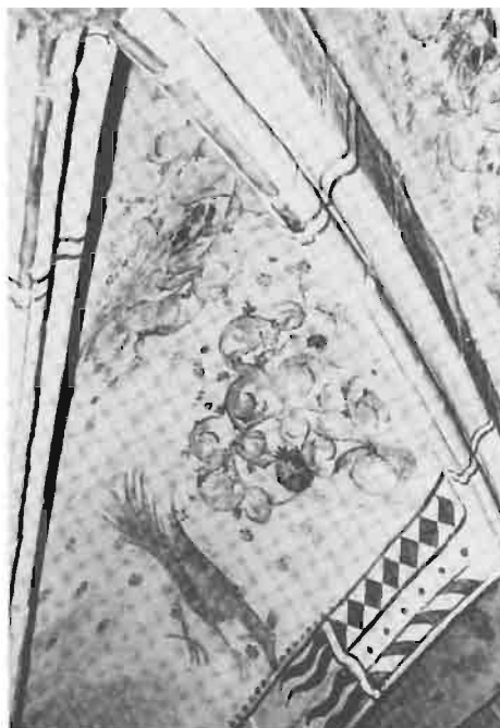
Afb. 12: De pauw (?), symbool van de onsterfelijkheid.