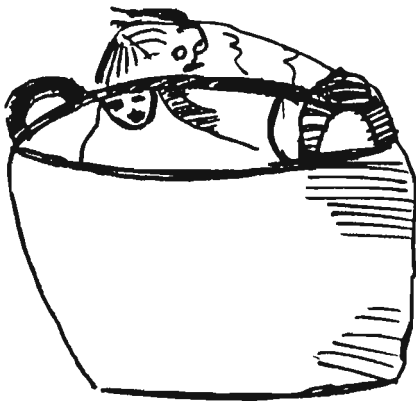
Afb. 5: Zondentas (met duivelse figuurtjes?). (St. Martinuskerk te Weert, detail uit travee 30).

(Of is er sprake van twee aparte voorwerpen gezien de scheidende streep ongeveer in het midden van het object?). Het heeft er alle schijn van dat de grotere de kleine duivel het voorwerp in de strot poogt te duwen. De gebruikelijke verklaring luidt: 'Een van de duiveltjes duwt een verdoemd slachtoffer een geweldig grote vis in de mond. Volgens Timmers wordt hier de ergste van alle ondeugden, de vraatzucht, uitgebeeld'. Deze uitleg kan ons niet overtuigen. De zielen van de zondaars worden immers gewoonlijk voorgesteld als naakte mensjes. Het 'slachtoffer' hier is echter duidelijk een deemoontje. Bovendien is het niet absoluut zeker dat hier een vis wordt bedoeld. Het is jammer dat de twee spreukbanden, die waarschijnlijk na-