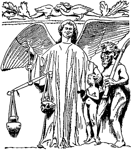
Afb. 7: Aartsengel Michael weegt. Laat-middeleeuws tympanonrelief.

de hemelpoort door een engel aan de sleutelbewaarder Petrus overgedragen. De Oordeelscène is ook uit de religieuze literatuur bekend. Vooral in de Marialegenden wordt ze uitvoerig beschreven. Zoals bij de rechtspraak betaamt is er sprake van een aanklager, de 'viant uter helle', en een verdediger, de maagd Maria. Ook hier is regelmatig sprake van een weegschaal. De goede en slechte daden van de mens worden gewogen. (vgl. b.v. Van enen mensche die sijn goede werken ende quade gheweghen worden voer den oerdel Gods). Geschreven brieven dienden als schriftelijke bewijsstukken. Als Maria met een ziel voor haar Zoon, de Opperrechter, treedt, gebeurt het volgende: 'Als si quamen voer onsen heer ihesum [Jezus], doe seide die viant dat die siel sijn waer, want hi hadde so veel