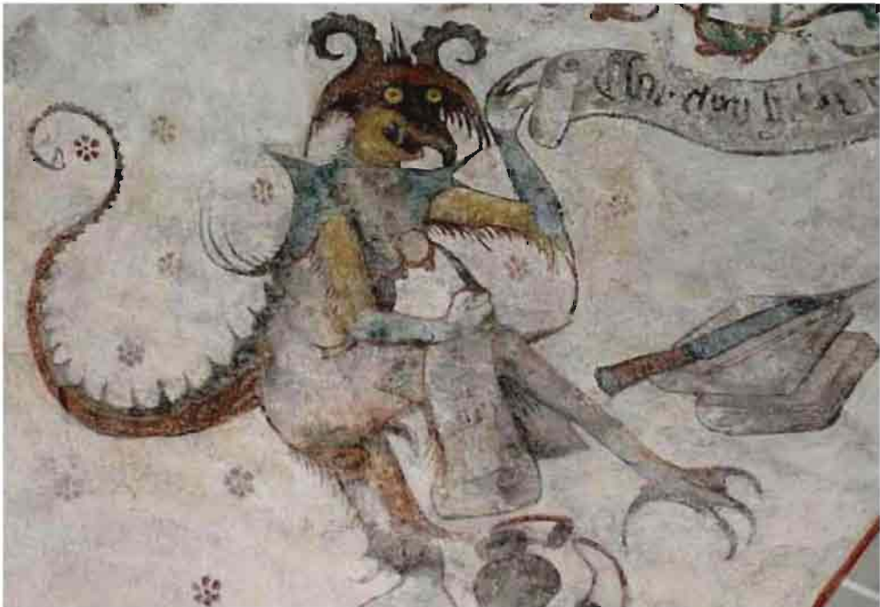
Afb. 3: Schrijvende duivel (St. Martinuskerk te Weert, travee 5).

Er zijn, waar het de afbeelding van duivels betreft, in de St. Martinuskerk twee traveeën te onderscheiden. In travee 5, gesitueerd rond het ringgat, treft men niet min-