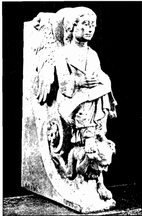
Afb. 1: Schrijvende engel, kalkstenen reliëf, Rijn- en Maasland, omstreeks 1210-1220.

De duivel heeft, binnen het Heilsplan Gods, derhalve ook zijn 'goede kant'. Hij is de boekhouder van het menselijke kwaad, terwijl daarentegen een engel de goede daden van de mens noteert. Dit schrijvende ambt van engel en duivel is reeds vroeg in de streken rond de Nederrijn en het Maasland bekend. Dit bewijzen twee uit kalksteen gehouwen romaanse beeldjes die rond 1210-1220 werden vervaardigd. Ze zijn 75 cm hoog en 53 cm breed. Ze vormen ontegenzeggelijk een 'paar', gezien het compositionele evenwicht dat er tussen beide afbeeldingen bestaat. Het ene beeldje toont een gevleugelde engel in zittende houding (afb. 1). Zijn voeten drukken op de nek van een dwergachtige demon. Het ernstige gezicht met de scherp observerende ogen verraden concentratie. In de rechterhand houdt de engel een schrijfpenn. Hij is gereed de goede werken van de rechtvaardige mens te noteren op de schrijfrol die op zijn knieën rust. Het andere beeldje toont de duivel (afb. 2). Zijn pose is met die van de engel vergelijkbaar. Met één voet op een dierlijk monster rustend, leunt hij half staand, half zittend tegen de achterwand. In zijn demonische kop, die in een grote