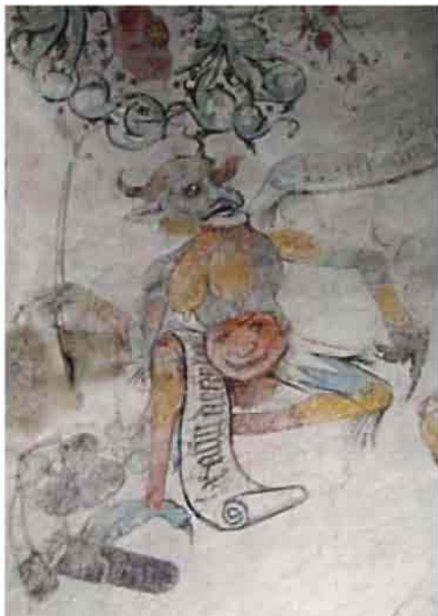
Afb. 4: Duivel met tronie op de buik. Schrijft zonden op, in de rechter hand pen, die in inktpot wordt gedoopt. Daarom pennemes en koker, attributen van 'clerc'. Hij wijst met de linker klauw naar tas (met zonden?). (St. Martinuskerk te Weert, travee 30).

staat in dezelfde beeldtraditie (afb. 4). Hij heeft dezelfde uiterlijke kenmerken als zijn collega in travee 5. Drietenige klauwen waar men voeten en handen verwacht. Opvallend grote hangende borsten, kromme neus, dierlijke, grote oren, en horens. Ook hij is op een knie neergeknield. Over zijn rechterknie hangt eveneens een lange, beschreven banderol. Ook hij is duidelijk bezig met zijn notatie-activiteiten. In zijn rechterhand houdt hij een lange schrijfspen. Hij staat op het punt de pen in een bolvormige inktpot te dopen. Onder de inktpot staan twee voorwerpen afgebeeld die men abusievelijk als 'een pijlenkoker met een pijl eruit' heeft geïdentificeerd. Deze krijgshaftige voorwerpen behoren in de traditie van de schrijvende duivel niet thuis. We herkennen de voorwerpen als een koker (in het middelnederlands schriftoerie of schrijfkoker genoemd) en een mes met greep en licht gekromd smal lemme (het 'schrijfmes' of pennemes). Het zijn de in de Middeleeuwen gebruikelijke attributen van de klerk (we troffen dezelfde voorwerpen bij de duivel in travee 5 aan). Bijzonder opvallend is de grij-