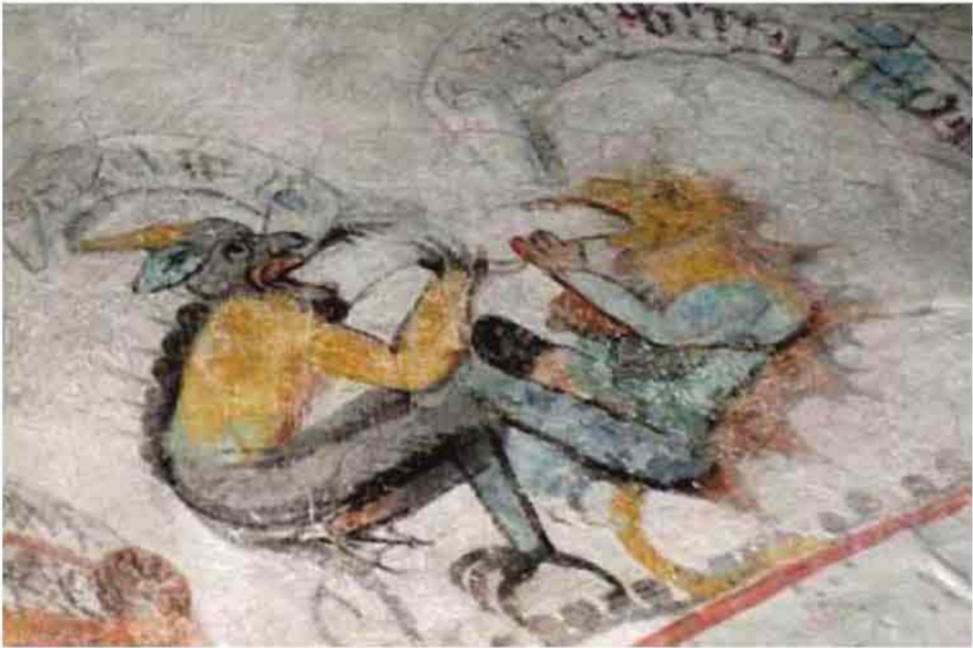
Afb. 6: Twee duivels in actie. (St. Martinuskerk te Weert, detail uit travee 30).