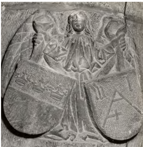
Afb. 3. St.-Martinuskerk, Weert: zuil met huismerk, mogelijk van de bouwmeester.

letters W en L. (afb. 3). Waarschijnlijk is dit het familiewapen van de bouwmeester, die dan uit Keulen afkomstig zou kunnen zijn. Helaas zijn alle nasporingen naar de betekenis van dit wapenmerk, ook in het buitenland, tot nu toe