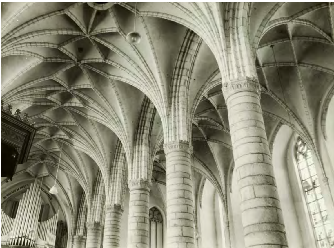
Afb. 2. St.-Martinuskerk, Weert: kapitelen en gewelven van de tweede bouwperiode.

aan de plaatsing van de steunberen: in het oudste gedeelte buiten en in het latere gedeelte binnen het gebouw. Ook de gewelfconstructie toont een onderscheid: voor in de kerk treft men eenvoudige kruisgewelven aan, die de ene travee scherp afscheiden van de andere, terwijl het nieuwere gedeelte een ingewikkelde ribbenconstructie heeft, die de ene travee ongemerkt laat overgaan in de andere en die bovendien drie verschillende figuren vertoont, n.l. in het midden stergewelven, links ruit- en rechts netgewelven (afb. 2). Ook bij de pijlers valt het primitieve van de eerste periode duidelijk op; men lette slechts op de eenvoudig geprofileerde kapitelen voor in de kerk en op de beeldhouwde kapitelen achterin, zogenaamde Maaskapitelen voorzien van plompe bladmotieven.