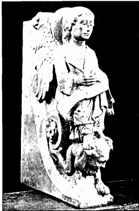
Afb. 1: Schrijvende engel, kalkstenen reliëf, Rijn- en Maasland, omstreeks 1210-1220.

De duivel heeft, binnen het Heilsplan Gods, derhalve ook zijn 'goede kant'. Hij is de boekhouder van het menselijke kwaad, terwijl daarentegen een engel de goede daden van de mens noteert. Dit schrijvende ambt van engel en duivel is reeds vroeg in de streken rond de Nederrijn en het Maasland bekend. Dit bewijzen twee uit kalksteen gehouwen romaanse beeldjes die rond 1210-1220 werden vervaardigd. Ze zijn 75 cm hoog en 53 cm breed. Ze vormen ontegenzeggelijk een 'paar', gezien het compositionele evenwicht dat er tussen beide afbeeldingen bestaat. Het ene beeldje toont een gevleugelde engel in zittende houding (afb. 1). Zijn voeten drukken op de nek van een dwergachtige demon. Het ernstige gezicht met de scherp observerende ogen verraden concentratie. In de rechterhand houdt de engel een schrijfpenn. Hij is gereed de goede werken van de rechtvaardige mens te noteren op de schrijffrol die op zijn knieën rust. Het andere beeldje toont de duivel (afb. 2). Zijn pose is met die van de engel vergelijkbaar. Met één voet op een dierlijk monster rustend, leunt hij half staand, half zittend tegen de achterwand. In zijn demonische kop, die in een grote