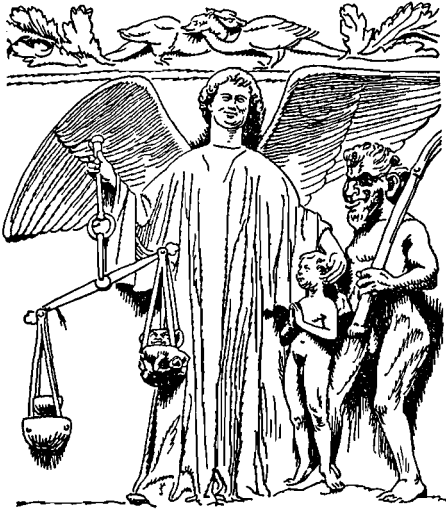
Afb. 7: Aartsengel Michael weegt. Laat-middeleeuws tympanonrelief.

de hemelpoort door een engel aan de sleutelbewaarder Petrus overgedragen. De Oordeelscène is ook uit de religieuze literatuur bekend. Vooral in de Marialegenden wordt ze uitvoerig beschreven. Zoals bij de rechtspraak betaamt is er sprake van een aanklager, de 'viant uter helle', en een verdediger, de maagd Maria. Ook hier is regelmatig sprake van een weegschaal. De goede en slechte daden van de mens worden gewogen. (vgl. b.v. Van enen mensche die sijn goede werken ende quade gheweghen worden voer den oerdel Gods). Geschreven brieven dienden als schriftelijke bewijsstukken. Als Maria met een ziel voor haar Zoon, de Opperrechter, treedt, gebeurt het volgende: 'Als si quamen voer onsen heer ihesum [Jezus], doe seide die viant dat die siel sijn waer, want hi hadde so veel