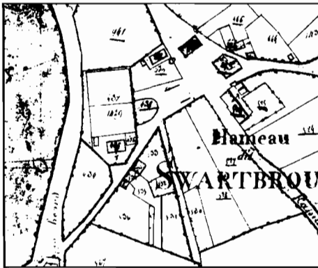
Kadastrale situatie ± 1820. De positie ligt op 435/436/437/1429.

Swartbroek kan de toekomstige rector nog meer bieden dan wat geld alleen. Om een zo noodzakelijk als godvruchtig werk als de oprichting van een rectoraat te ondersteunen, presenteren de inwoners een bouwplaats met tuin. Deze is gelegen vlakbij de kapel, in het midden van het gehucht. De bouwplaats –waarschijnlijk op "gemeente"-grond– kost hun natuurlijk niets; daarom bieden de inwoners "uijt puijre generositeijt" tevens aan op hun kosten een passend huis voor de toekomstige rector te bouwen.