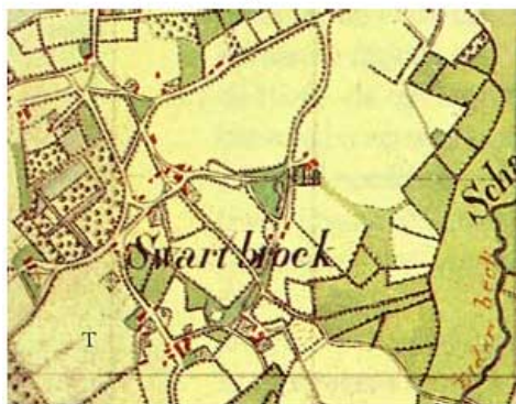
Swartbroek rond 1820. (Tranchot-kaart)

Het advies van Janssens wordt door de inwoners van Swartbroek niet bijzonder gewaardeerd, dat blijkt wel uit het bitse commentaar 47 van hun advocaat.