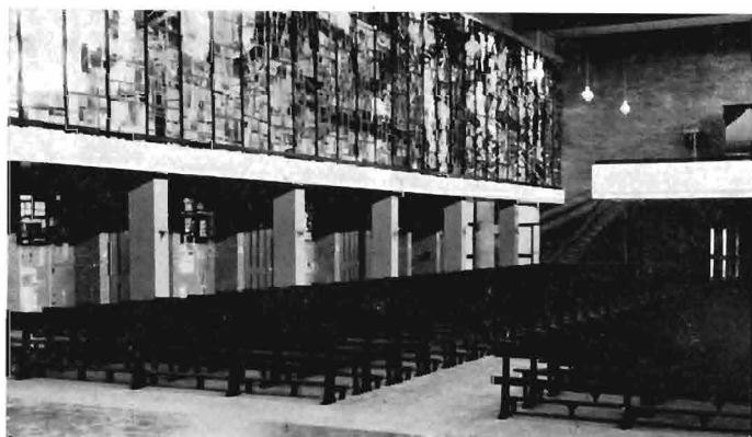
Interieur gezien vanaf het priesterkoor

Het is een opgave om tweehonderdveertig vierkante meter te beglazen. Het moet een monumentale wand zijn, maar anderzijds zijn de formaten van dien aard, dat een volkomen abstracte oplossing vervelend zou worden, omdat men in abstracte verbeelding de spankracht in dit vlak nauwelijks vast kan houden. Daan Wildschut wist hier een van zijn belangrijke werken tot stand te brengen.