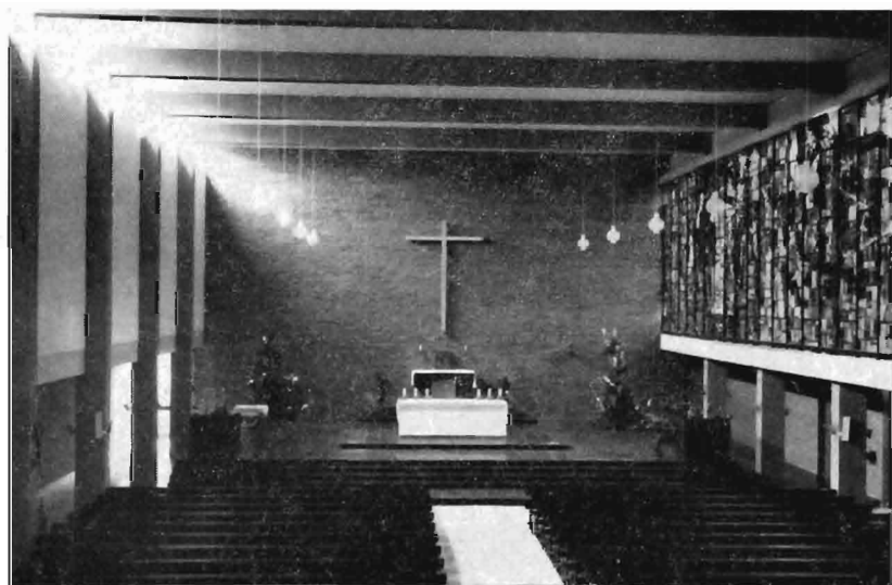
Interieur van de nieuwe St Franciscuskerk, Biest, Weert.

een kenmerkende karakterbepaling werd voor het geheel: zoals daar die klokken hangen, zal zowel de verbinding met het historische Weert als ook de associatie aan het moderne industriële Weert zeer discreet tot stand gekomen zijn, want deze klokkentoren doet zowel denken aan een moderne kerk als aan de bekroning van een fabriekscomplex, zonder overigens te nadrukkelijk te werken als storend element voor het oude historische gebouw.