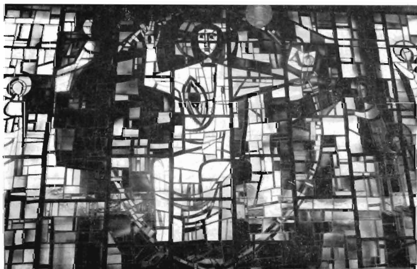
De verheerlijkte Christus.

Gezien het monumentale karakter van deze opgave, dat de architectuur van deze nuchtere zaalkerk zijn proporties moest geven, beschilderde hij het glas niet, doch werkte de tableaux uit in gebrand antiek-glas, waarin het herkenbare gegeven uitsluitend wordt bepaald door de loodstrips. Vanaf het priesterkoor ziet men achtereenvolgens de verheerlijkte Christus, omgeven door engelen, daarna een verbeelding van de schepping, de triomfale zon, de maan, het sterrenfirmament, dan de levensboom en Adam en Eva, strak maar in vormgeving gespannen in blank glas verbeeld, een grootse ornamentale verbeelding van de dieren, zoogdieren, vogels en vissen en tenslotte de stigmatisatie van St. Frans in een naar kleur brandend tafereel weergegeven naast het oksaal. Het eerste dat opvalt is het