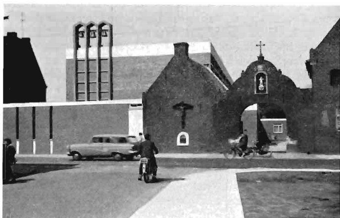
Exterieur gezien vanuit de Kloosterstraat.

MODERNE KERKZAAL MET LUISTERRIJKE GLASWAND