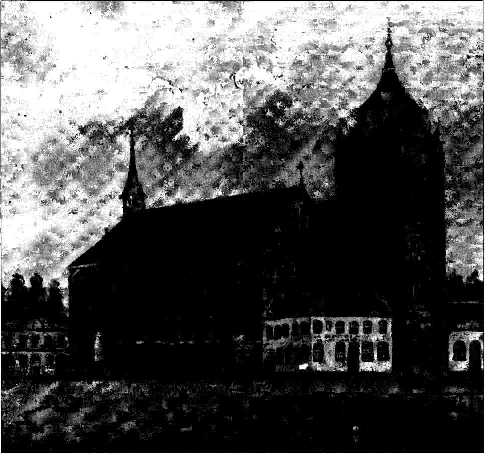
Schilderij uit 1853, vervaardigd door Sassen. Rechts naast de toren de vleeshal.

1827, omdat zij de pacht voor dat jaar opgezegd zouden hebben. De gemeenteraad besloot echter op 3 september 1828 om de klacht ongegrond te verklaren. De pachtprijs voor 1828, die ten tijde dat de slagers de hal moesten verlaten, was beginnen te lopen, zou niet ingevorderd worden. Na hernieuwde klachten van de slagers besloot de raad op 6 september om de pachtsom voor 1827 met een derde te verminderen. 19