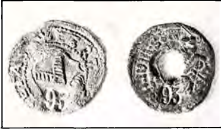
Twee loodjes ter waarmede van de goederen door het wollenambacht vervaardigd. Eig. Museum de Tiendschuur Weert. P.S. Het getal 93 is in 1949 aangebracht als cat.nr. van het museumbezit.

Na 1700 is er dan ook weinig meer over van deze eens zo bloeiende industrie. Reeds in de 16e eeuw ging de handel in Bergen op Zoom sterk achteruit vooral tengevolge van de economische teruggang van deze stad. Ook de handel op Holland ging met grote moeilijkheden gepaard, daar de kooplieden de grens tussen de zuidelijke en de noordelijke Nederlanden moesten passeren. Na 1663 blijkt er niets meer van een handel op de Republiek.