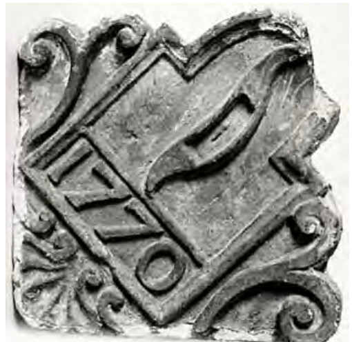
Ruitvormige zandsteen met siermotieven rond weversspoel en jaartal 1770. De steen heeft gestaan in de Molenstraat in het huis van een lid van het Wollenambacht. Berust thans in het Museum de Tiendschuur.