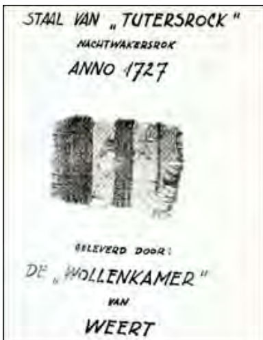
Staal "Tutersrock". Aanwezig in Museum de Tiendschuur.

Wel bleef er gedurende de gehele 16e eeuw en zelfs ook nog in de 17e eeuw een handel op Antwerpen, Brussel en Mechelen bestaan. Er zijn daarvan meerdere bewijzen. Op 18 november 1578 verleende Aartshertog Mathias van Oostenrijk aan de ingezetenen van Weert een privilegiebrief inzake de vrije handel in lakens. 13 In maart 1580 richtte Adolf Graaf van Nieuwenaer vanuit Weert een verzoek aan burgemeester, schepenen en raad der stad Antwerpen om er op toe te zien, dat aan de Weerter kooplieden tijdens de uitoefening van hun beroep geen schade zou worden berokkend. 14 In februari 1583 gaf Willem van Oranje aan alle magistraten, officieren en krijgsoversten bevel om de ingezetenen van Weert vrij hun lakens te laten uitvoeren naar Antwerpen en andere plaatsen vallende onder de autoriteit van "de