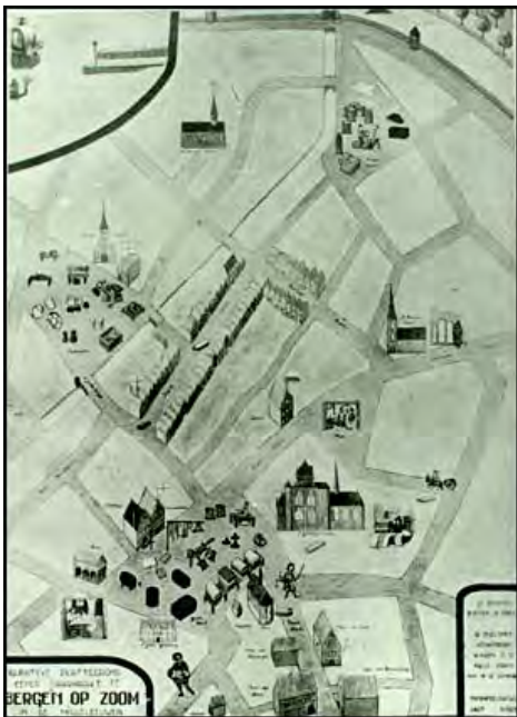
De situering van de Weerter lakenhal in Bergen op Zoom (midden onderaan). Uittreksel uit: "Jaarmarktvrijheid en Ambachtskeuze te Bergen op Zoom" door C. Slotmans.

De twee belangrijkste plaatsen, waarheen het Weerter laken werd uitgevoerd om van daaruit verder te worden verhandeld, waren Bergen op Zoom en Antwerpen. Kooplui van elders, die met een gezocht artikel op de vrije jaarmarkten in deze steden uitkwamen, kregen hier over het algemeen een voorkeurspositie. Vooral de lakenhandelaren profiteerden daarvan; zij pachtten dan een plaats in de stedelijke lakenhal ofwel zij huurden of kochten een eigen pand als opslagruimte. Naast Maastricht en Roermond speelden vooral ”de gewantmaekers” (= wolwevers) van Weert sinds het midden van de 15e eeuw een rol op de twee Bergse jaarmarkten. De Bergse lakenkooplieden fabriceerden zelf geen laken doch handelden in elders gemaakte lakens. Het kwantum laken uit Weert was zodanig, dat de gezworen werkmeesters Rutgher Daniels en Jacob Brouwers uit Weert op 26 november 1476 van