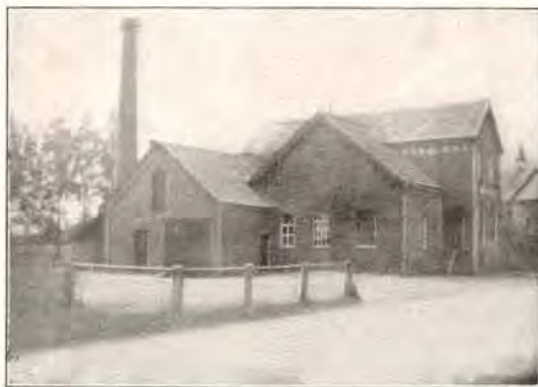
EEN MODERNE STOOMZUIVELFABRIEK: STRAMPROY-TUNGELROY.