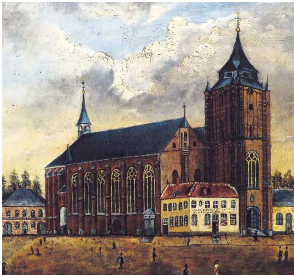
Schilderij uit 1853, vervaardigd door Sassen. Rechts naast de toren de vleeshal.

1827, omdat zij de pacht voor dat jaar opgezegd zouden hebben. De gemeenteraad besloot echter op 3 september 1828 om de klacht ongegrond te verklaren. De pacht prijs voor 1828, die ten tijde dat de slagers de hal moesten verlaten, was beginnen te lopen, zou niet ingevorderd worden. Na hernieuwde klachten van de slagers besloot de raad op 6 september om de pachtsom voor 1827 met een derde te verminderen. 19