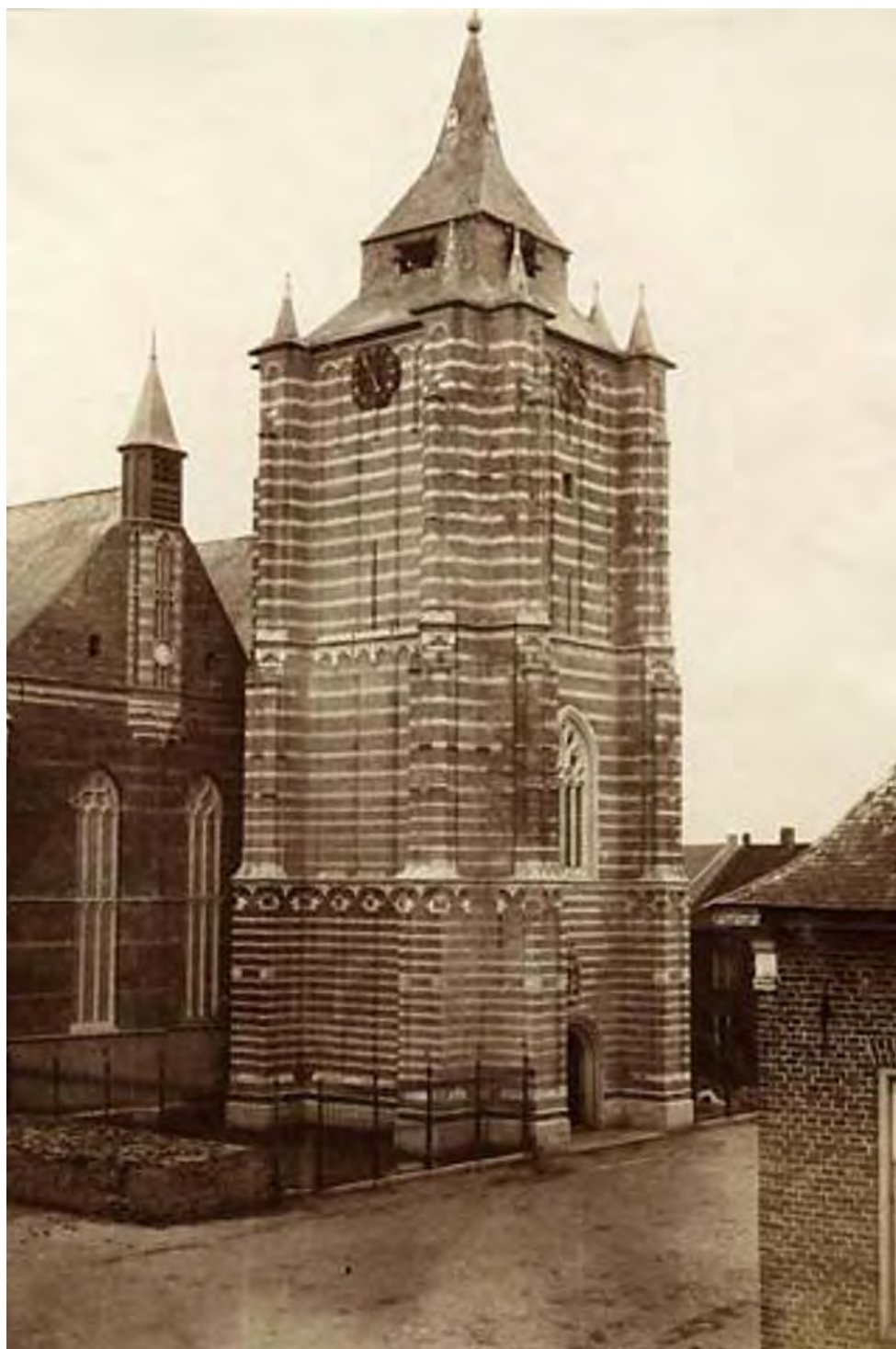
De toren na de sloop van beide gebouwen.