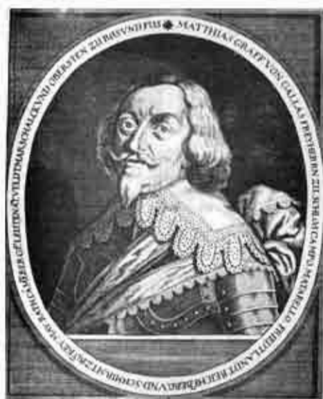
De keizerlijke generaal Matthias Gallas.