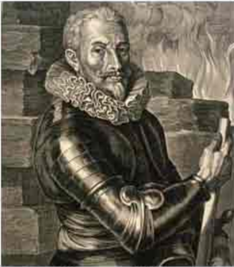
De keizerlijke generaal Tilly naar Anton van Dijck.

van de stad. De verdedigingswerken verkeerden in slechte staat en dienden nodig gerepareerd te worden. Zo liet hij eigenmachtig en zonder 'goeddenken' van de Pilsener burgers gebouwen voor fortificatiedoeleinden slopen, waartegen dezen bezwaar maakten. Doel hiervan was om aan bouwmaterialen te komen, zoals ook later in Eger gebeurde en niet omdat deze gebouwen de fortificatiebouw in de weg stonden. De instemming van de burgers zou in dat laatste geval slechts bijzaak zijn geweest.