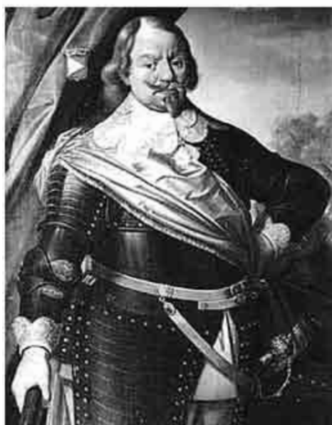
De Zweedse generaal Johan Banér.