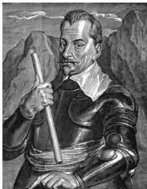
ALBERT. BVX .FRITLAND. COM. WALLEST. ETC. Albrecht von Wallenstein naar Anton van Dijk in Theatrum Europaeum III van Matthäus Merian.