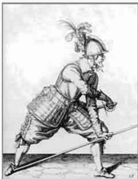
Pikener in gevecht naar tekening van Jacob de Gheyn. Deed voornamelijk verdedigingswerk in gesloten front tegen de aanstormende cavalerie.