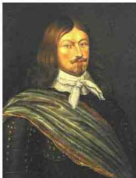
De Zweedse generaal Lennart Torstensson.