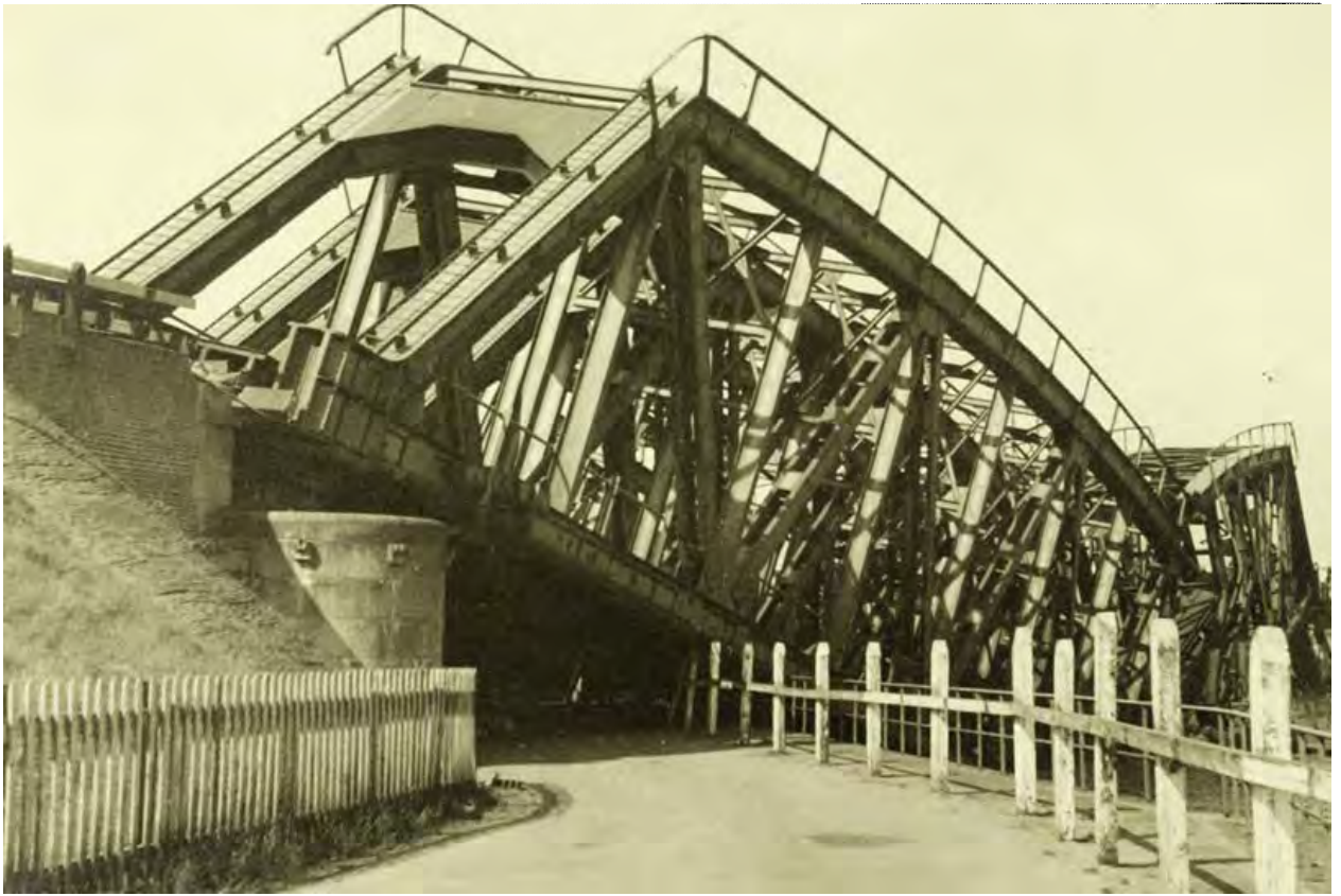
Afb. 2 De spoorbrug bij Weert mei 1940