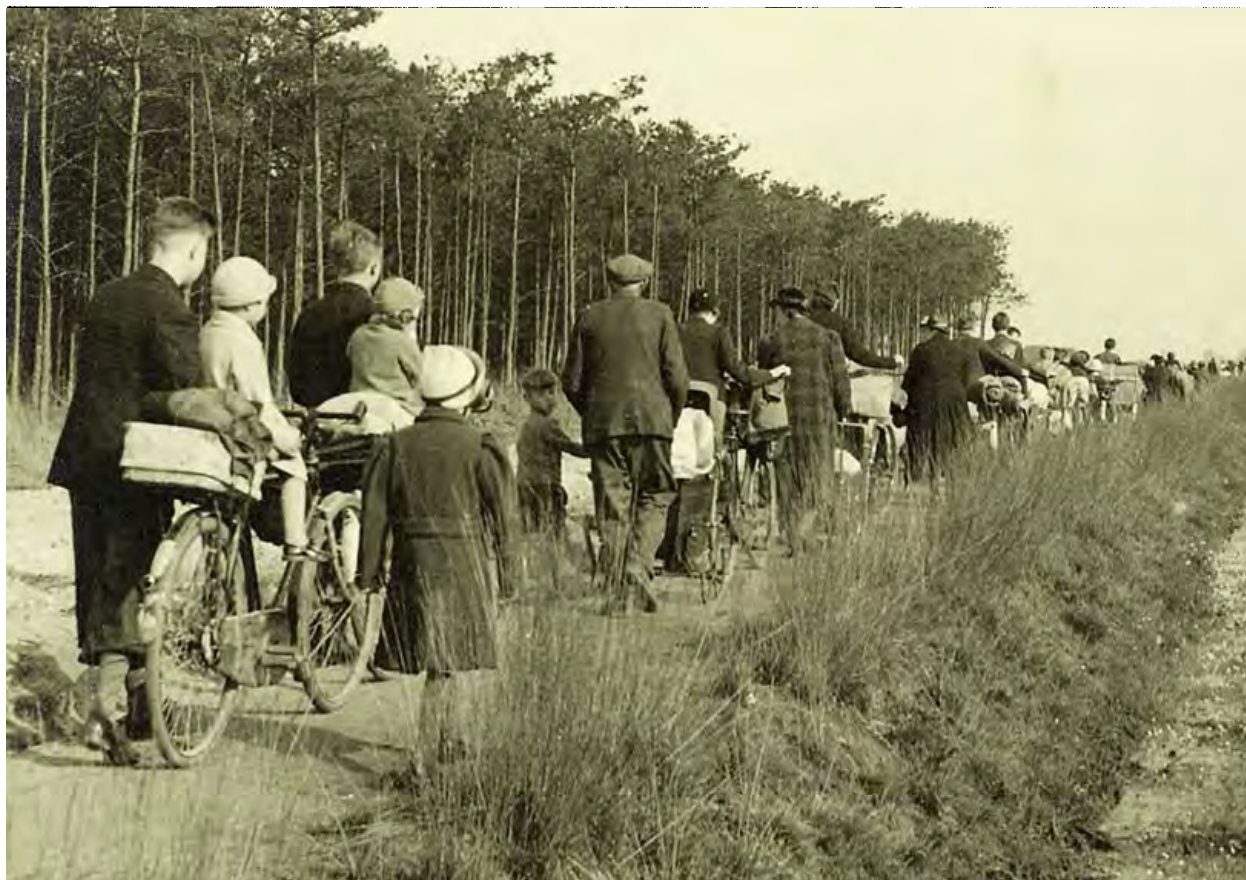
Afb. 1 Zó evacueerden Weert en Nederweert 10 mei 1940.