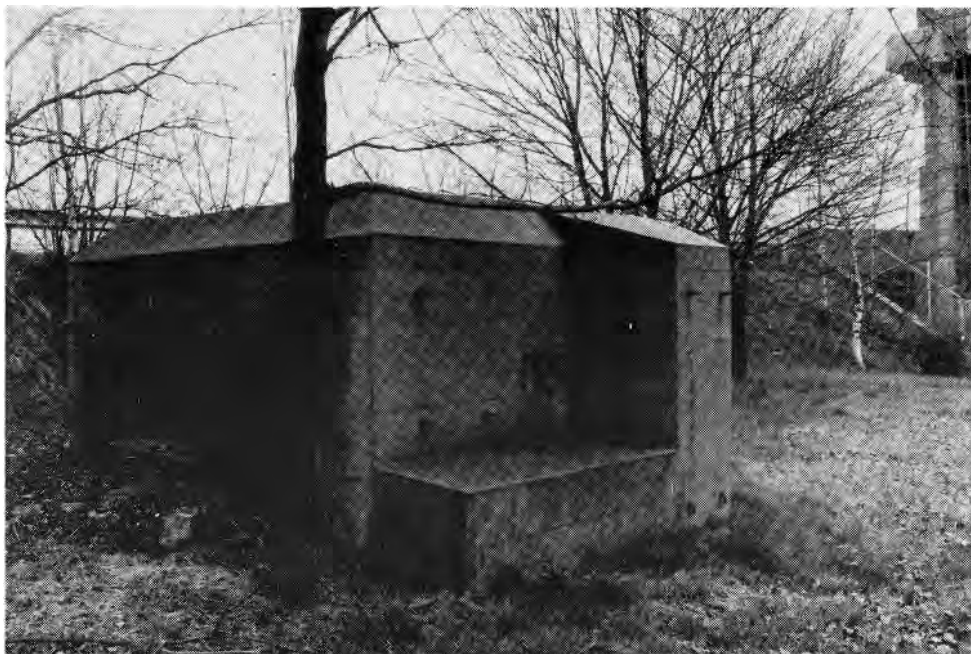
Kazemat bij Sluis 16.