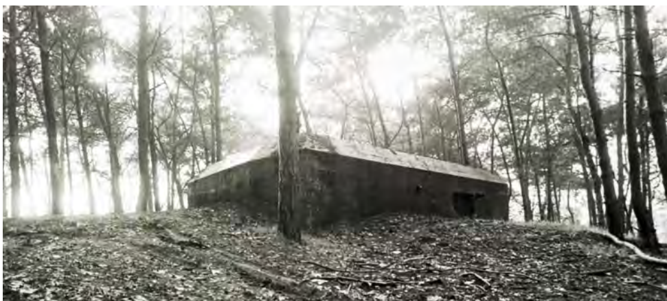
In 1990 gesloopte kazemat hoek Kempenweg/Trancheeweg.