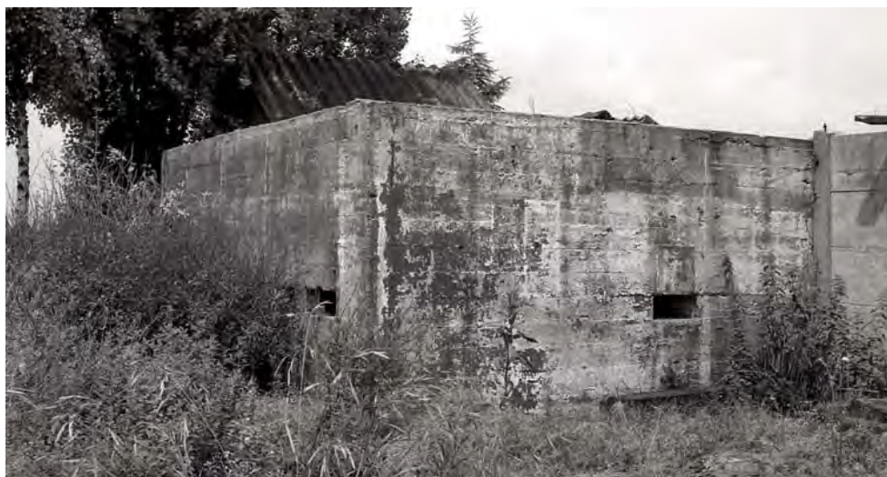
Kazemat achter woning Noordkade 21.