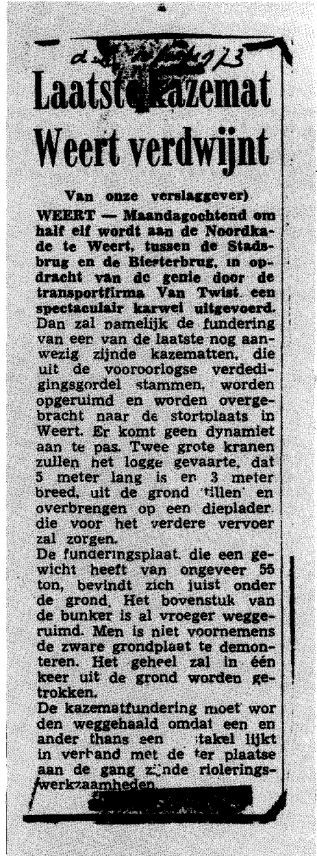
Artikel "De Limburger" 10-11-1973.

Uit een in november 1945 door de gemeente Weert gemaakte inventarisatie ten behoeve van de inspecteur der Genie blijkt dat op dat moment binnen de grenzen van Weert nog 60 permanente defensieve werken aanwezig waren. Het betrof 39 betonkazematten, 15 gemetselde bunkers, 5 betonblok-wegversperringen en 1 duiker met aansluitingen. In de loop van de jaren zijn om uiteenlopende redenen zoveel van deze restanten gesloopt, dat nu nog, naast de duiker en de defensiedijk, 14 kazematten over zijn gebleven. In tegenstelling tot de vaak zwaar beschadigde overblijfselen in het noordelijk gedeelte bij Mill, genieten deze restanten geen enkele wettelijke bescherming.