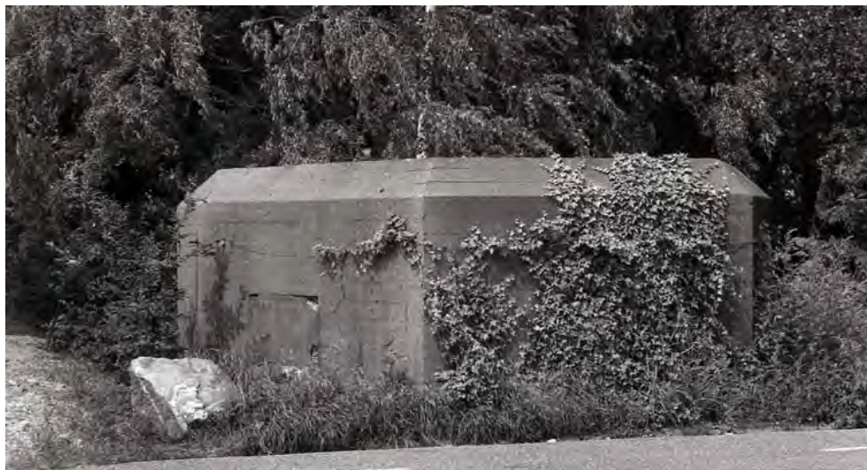
Kazemat langs Noordkade.