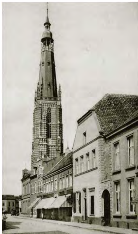
De manufacturenzaak en leerlooierij Clercx in de Langstraat (met zonwering).