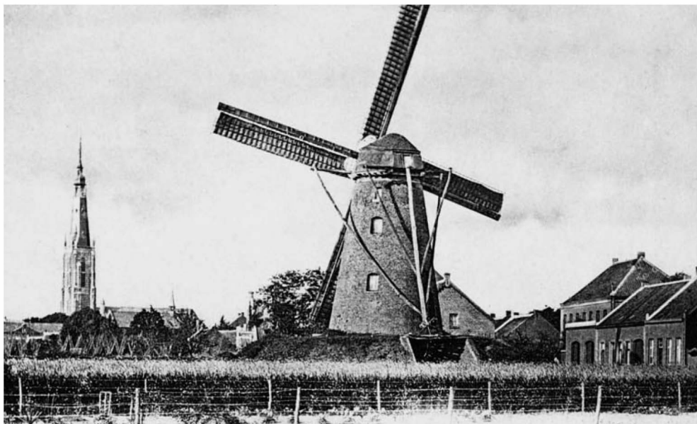
De Clercxmolen op de Dries.