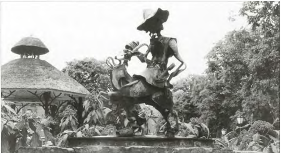
Op de oude Markt in Overpelt staat het Bokkenrijdersbeeldje van kunstenaar Willy Ceyskens, dat onthuld werd tijdens de drossaard Clercx-feesten in 1960.

Na de inval van het Franse leger in 1794 vluchtte hij als voornamelijk magistraat naar het rijksvorstendom Thorn en werd na terugkomst de leider van het verzet in het nieuw gecreëerde arrondissement van Roermond met als bekende verzetshaard op het Hobosch. Na de tragedie van de wrede boerenkrijg in december 1798 werd hij algemeen leider van het Vlaamse verzet. Mede namens dit verzet werd hij diplomatiek onderhandelaar te Emmerich en te Münster met de toenmalige grootmachten, Engeland vooral. Hij kreeg de beschikking over ca. 4000 manschappen, niet veel, maar Clercx kon alles gebruiken!