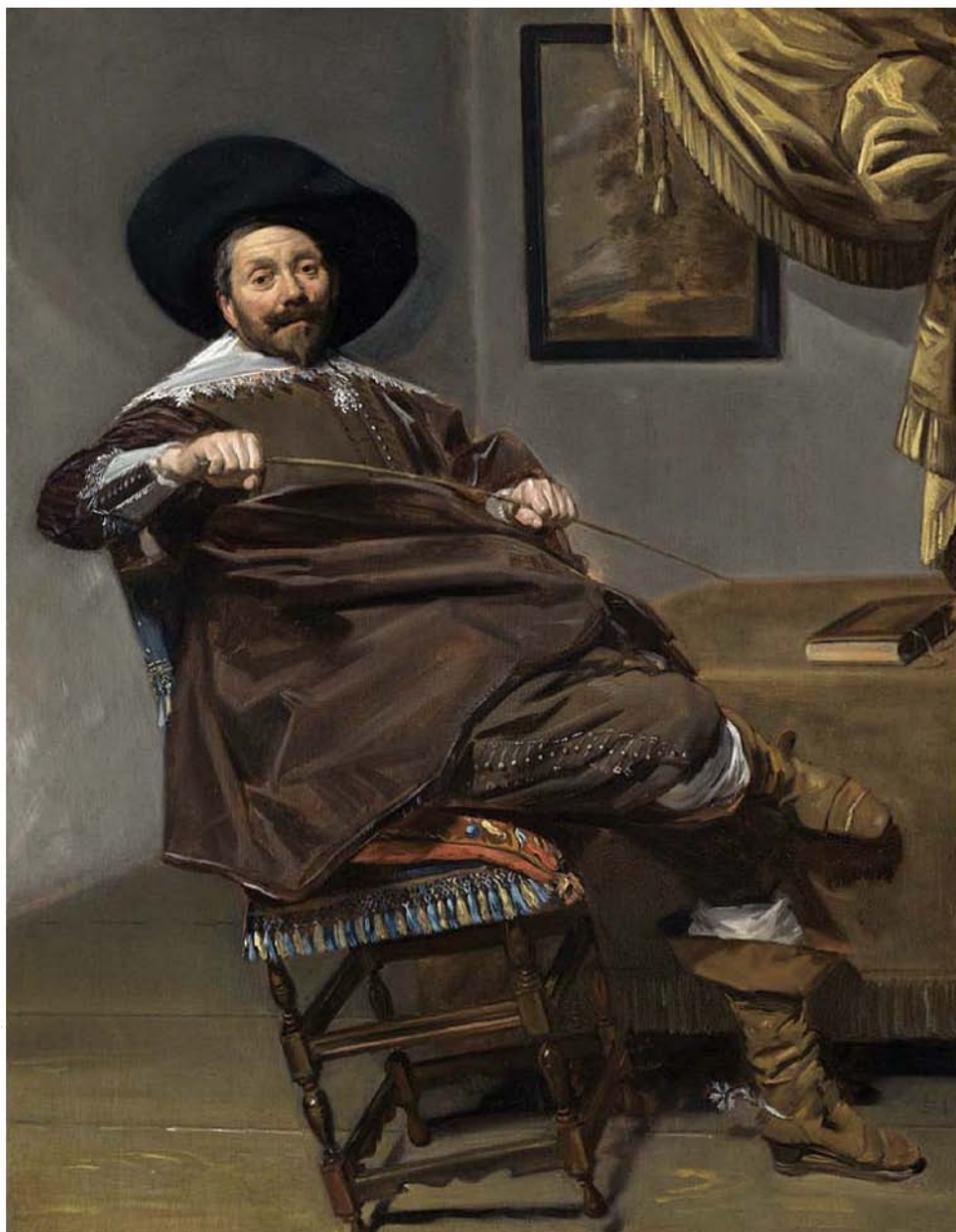
Portret geschilderd door Frans Hals van de Weerder koopman Willem van Heijthuijsen, stichter van een hofje te Weert en te Haarlem. (Museum voor Schone Kunsten te Brussel).

personen uit Weert en omgeving woonden. In de achttiende-eeuwse registers van personen die met toestemming van de magistraat in de stad kwamen wonen en genaturaliseerd werden, zien we dat de Weertenaren zeer verspreid over de stad woonden. 58 Buiten de stad, in de nabijheid van de blekerijen, woonden de blekers.