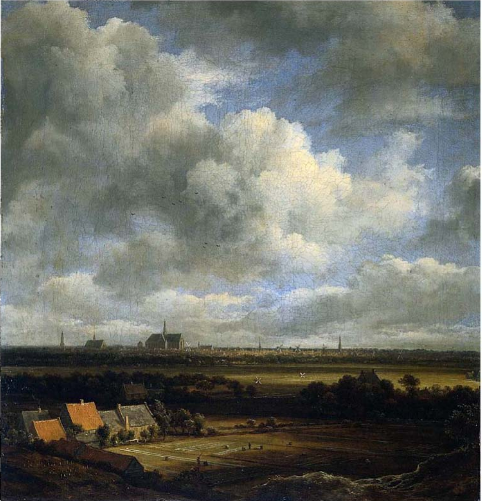
Gezicht op Haarlem uit het noordwesten met de blekerijen op de voorgrond, geschilderd door Jacob Isaacs van Ruisdael. (Rijksmuseum te Amsterdam).