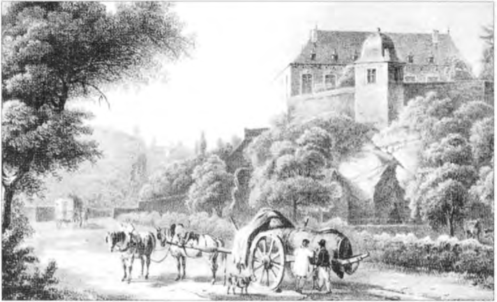
Kasteel van la Rochette bij Chaudfontaine. Bezit van de graven van Arberg.

Arberg - deze was hangende de behandeling van het rekest tijdelijk geschorst - wordt nadien niets meer vernomen.