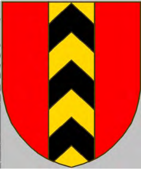
Wapen van de graven van Arberg.