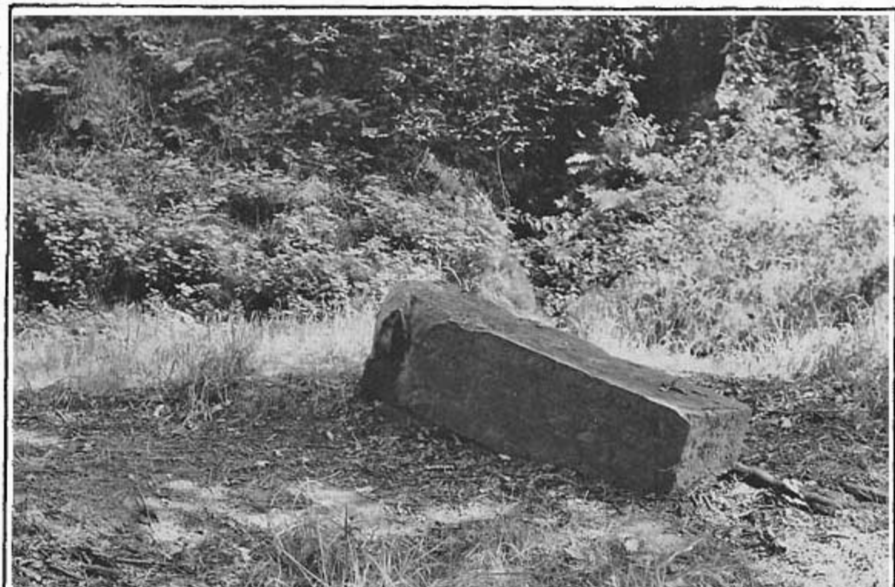
De afgebroken Meulenstatpaal, augustus 1987

Ieder betaalde een vierde deel van de kosten, oftewel 13 gulden en 10 stuivers. Het corpus Maarheeze-Soerendonk-Gastel had voorgesteld ook een deel te betalen maar "die van Budel hadden gerefuseert hun daer-inne t'accepteren, ofte te willen laeten betaelen in de selve kosten" (19). Zou Budel nog iets goed hebben willen maken? Een kleine eeuw later was Budel niet minder toegeeflijk toen ze ter oplossing van een grensgeschil met Maarheeze gebied aan deze gemeente toegaf. Vanaf 1 juni 1830 grenst de gemeente Budel dan ook niet meer aan de Meulenstatpaal (20). Het werd stil rond het oude grenspunt. In 1916 werd vlak naast de paal het Sterksels Kanaal handmatig gegraven. In de jaren zestig werd de naam van de grenspaal overgenomen door de regionale woningstichting 'Meulenstat'. De laatste echte beproeving onderging de paal op 23 mei in 1986, toen hij werd omgereden en afbrak. De stichting Het Limburgs Landschap en de gemeente Nederweert droegen in overleg met de Rijksdienst voor de Monumentenzorg zorg voor het herstel. De herstellende paal werd op 24 november 1987 herplaatst. Heemkundekring 'Budel en Cranendonck' was bij dit alles via haar werkgroep monumenteninventarisatie gemeente Maarheeze zijdelings betrokken en nam het initiatief een tekstplaque met uitleg over de paal te plaatsen.