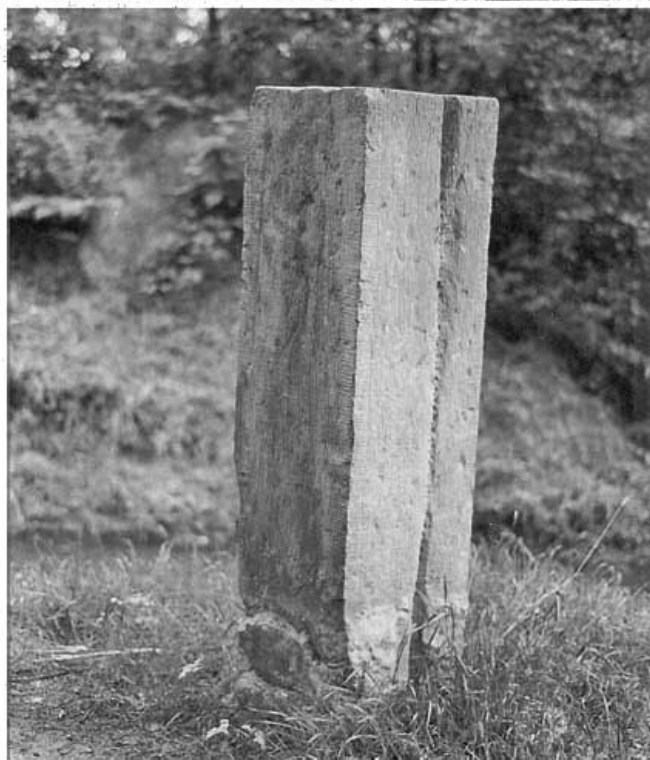
In oude glorie hersteld, augustus 1988.